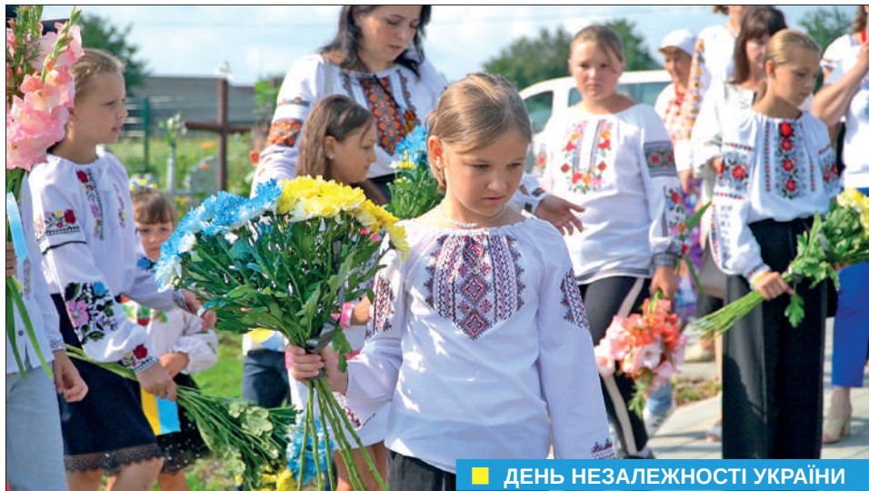
■ ДЕНЬ НЕЗАЛЕЖНОСТІ УКРАЇНИ