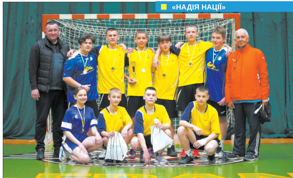
■ «НАДІЯ НАЦІЇ»

На базі ВСП «Івано-Франківський фаховий коледж фізичного виховання Національного університету фізичного виховання і спорту України» провели спортивні змагання «Надія нації» серед закладів загальної середньої освіти Івано-Франківського району.