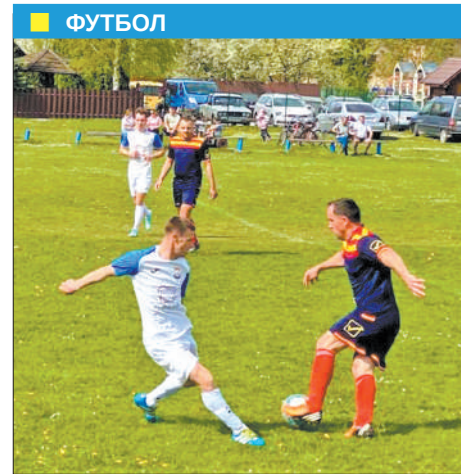
Зовсім інакше виглядає ситуація в «Юніора». Футболісти з Лисця, незважаючи на поразку в шістнадцятому турі у вищому матчі з ФК «Саджава» (1:2), впевнено посідають друге місце в групі С. Перед тим вони без проблем розібралися вдома з ФК «Медина» — 4:1. Наразі «Юніор» набрав 31 очко і випереджає на два очки двох найближчих переслідувачів — ФК «Старі Кривотули» та своїх кривдників із Саджави. Команда «Карпати» із Старих Богородчан, яка ще недавно ділила з «юніорами» друге місце, після кількох невдач опустилася на четверту сходинку турнірної таблиці.

Старолисецька команда, яка отримала нову назву й бореться за виживання в Суперлізі, програла обидва матчі — футбольним клубам «Металіст» і «Клубівці». Наразі в її доробку — одна перемога й три нічиї при десятих поразках. Пропущено аж 57 голів, що свідчить про глибоку кризу в захисті. До рятівного десятого місця, що дає право поборотися за місце в елітному дивізіоні в перехідних матчах (на ньому розташувався ФК «Марківці-Сільгоспхімія»), — усього три очки. Так що справа виглядає далеко не безнадійною, команді потрібно зібратися й проявити волю та бажання перемагати.