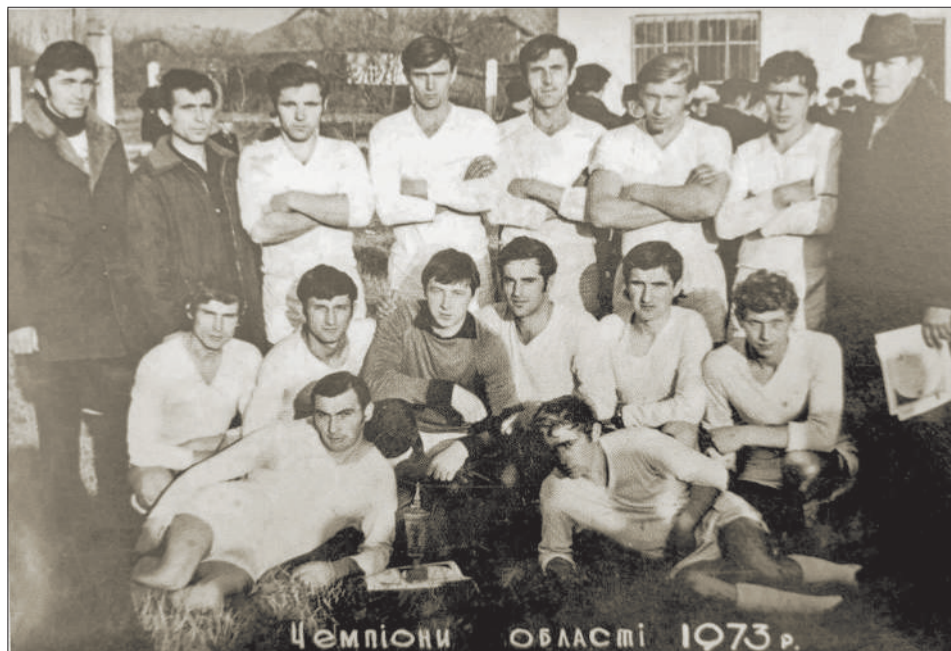
Чемпіони області 1973 р.

(Дивіться відео на ютуб-каналі територіальної громади)