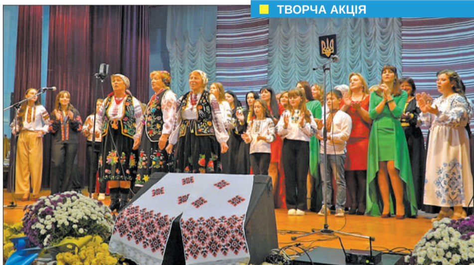
■ ТВОРЧА АКЦІЯ

«Україна молиться, Україна бореться, Україна з Божою поміччю переможе! — запевнили у своїх промовах священно-